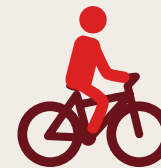
des cyclistes voltigeurs